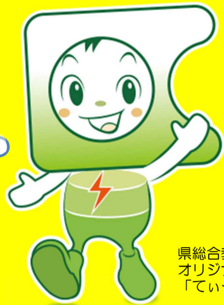
県総合教育センター オリジナルキャラクター 「ていーらん」